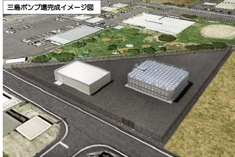
配水池に水を送るポンプ棟 (画像左)

妙見浄水場の水を三島地域に届けるために三島ポンプ場を建設しています。(令和6年度完成予定)