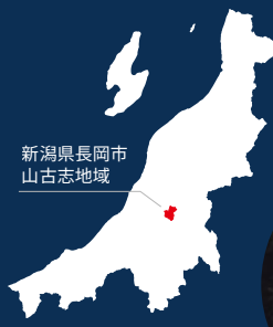
新潟県長岡市 山古志地域

山古志は新潟県長岡市の南東部に位置する、豊かな自然の残る地域。 国指定重要無形民俗文化財である「牛の角突き」や、 世界を魅了する泳ぐ宝石「錦鯉」発祥の地であり、 養鯉業が盛んなことで有名です。 周囲を山に囲まれ、冬には豪雪となる山古志を含む一帯地域。 厳しい環境を知恵と技術で恩恵へと転じたこの地域の棚田・棚池のシステムは、 日本農業遺産として認定されています。