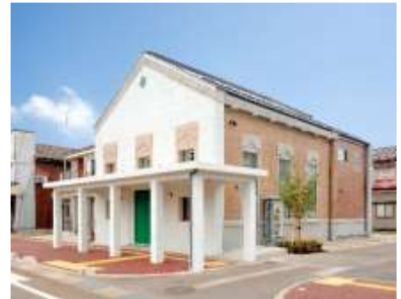
▲秋山孝ポスター美術館長岡 外観

※毎週土曜日・日曜日には「日和やのだ いどころ（長岡市高町4丁目858-365）」 が出店します。