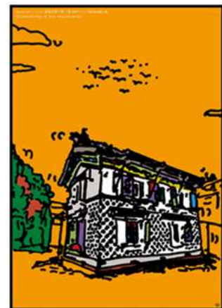
▲作品名：越後百景十選 八番 機那サフラン酒製造本舗土蔵（2012）