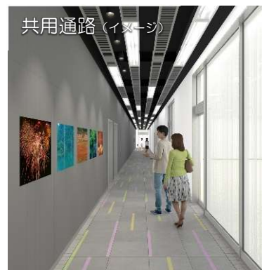
共用通路（イメージ）

内科、小児科、皮膚科、 リウマチ科、アレルギー科、 小児皮膚科、呼吸器内科、 糖尿病内科、腎臓内科