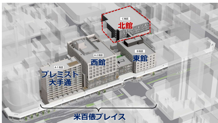
「米百俵プレイス」 鳥瞰イメージ