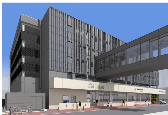
「米百俵プレイス 北館」 完成イメージ