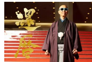
サンプルザ中野くん