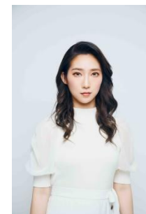
ファーストサマーウイカ