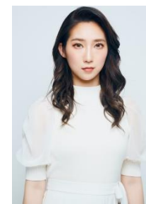
ファーストサマーウイカ