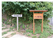
春は桜、夏の涼風、秋は紅葉、冬の雪景色と、1年を通じて訪れる人を楽しませてくれる。