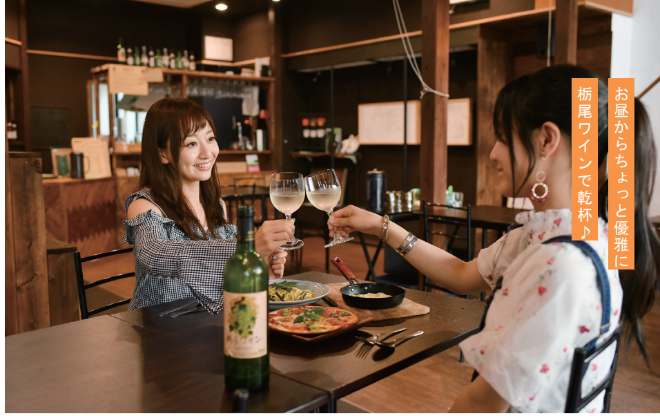
お昼からちよつと優雅に 栃尾ワインで乾杯♪