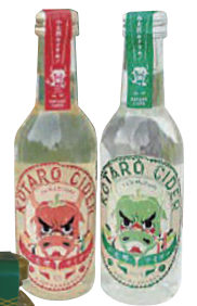
山古志の名物・かぐらなんぼんにちなんだ商品を扱う。