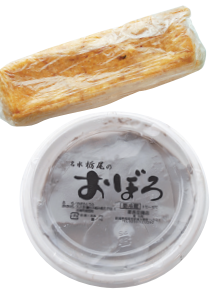
おぼろとうふは白、青豆、黒豆、特選の4種類。

地元の人だけでなく市外や県外からもファンが訪れる老舗豆腐店。昨年のリニューアルで広い駐車場を新設し、より利用しやすくなった。とろりとした口当たりの「おぼろとうふ」をはじめ、あぶらげ、豆乳を販売している。