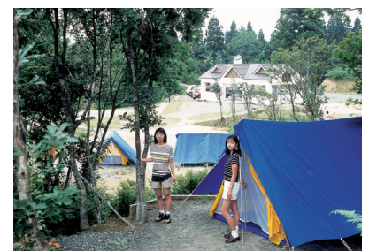
コテージや炊事場もあり、キャンプやバーベキューも楽しめる。(要予約)