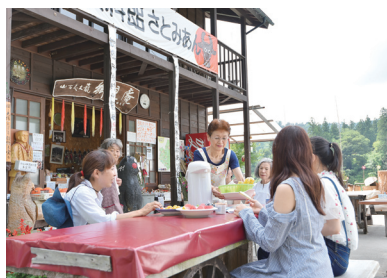
郷見庵のスタッフや近所のお母さんたちが集う。建物の2階では、資料として震災当時の映像が見られる。

長岡市山古志東竹沢丙1179-17 ☎0258-59-2180(郷見庵) 9時～16時 12月～4月頃 あり