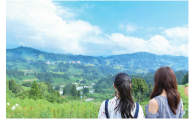
農村の原風景を残す美しい棚田は、朝・昼・夕で全く異なる表情を見せる。