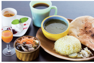
グリーンカレー(サラダ付き)780円やクレームブリュレ300円など。