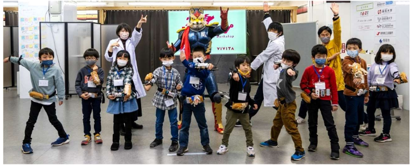
変身グッズの音や光に合わせて、ご当地ヒーロー・トチオンガーセブンと一緒に変身ポーズを披露しました。