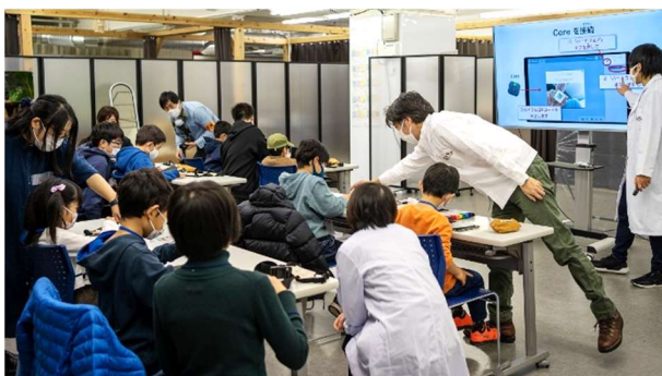
プログラミングの説明の様子。子どもたちのアイデアが形になるようにサポートしました。