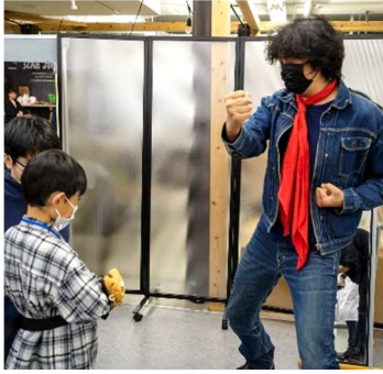
変身ポーズを考案。