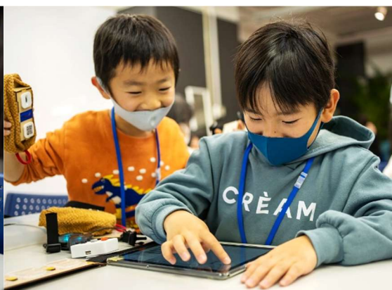
センサーや電子回路が組み込まれたデバイスをつなぎ合わせ、タブレット上のアプリでプログラミングすることで、音が出たりLEDが光ったりするオリジナルの変身グッズを制作しました。