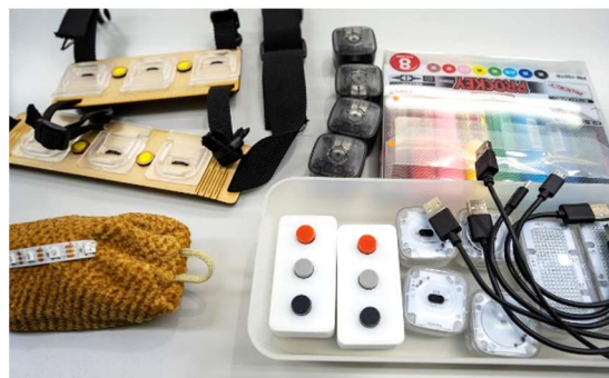
VIVIWARE(株)が開発したプロトタイピングツール「VIVIWARE Cell」を使用。