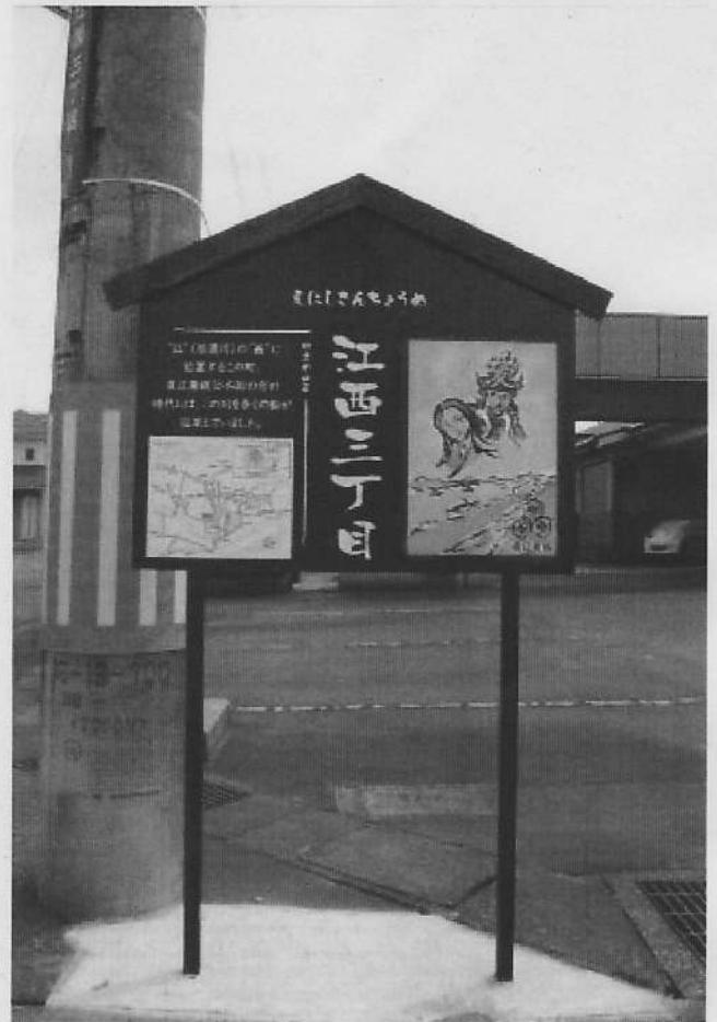
江西三丁目町内会