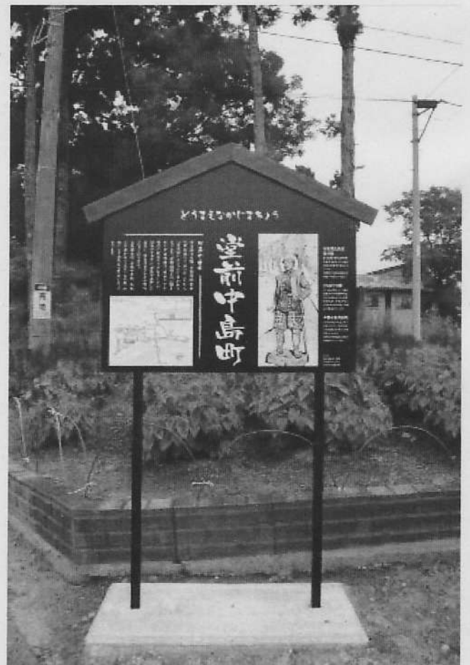
堂前中島町町内会