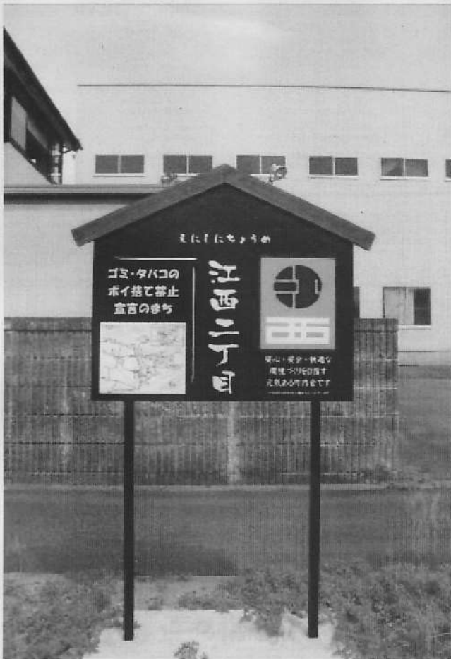
江西二丁目町内会