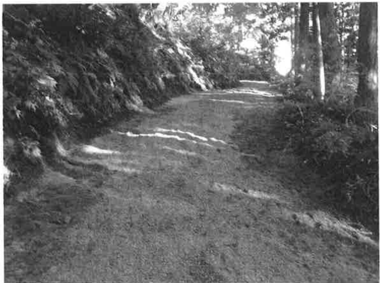
整地・ウッドチップ敷き完了