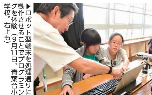
▲ロボット型端末を処理通りに動作させることでプログラミングを体験（9月11日、青葉台小学校。右上も）

▲授業で使用するロボット型端末。プログラミングにより、話す・歩く・歌うなどの動作ができます