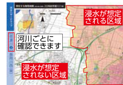
マップ上の色分けで自宅の浸水の深さを確認

視覚障害者向けの点字、音声読み上げ版や外国人向けの英語・中国語・ベトナム語・やさしい日本語版もあります