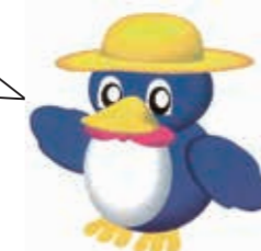
▲長岡の環境キャラクター・ペギーちゃん

ごみは、収集日を確認して、必ず午前8時30分までに 出しましょう。 ごみの分別に一層のご理解とご協力をお願いします。