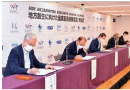
地方創生に向けた産業創造連携協定の締結式。ビデオ通話での商談を想定した、錦鯉の高精細映像の配信(いずれも10月22日)

国産イノベーション課 ☎ 39・2402、 デジタル行政推進課 ☎ 39・2205