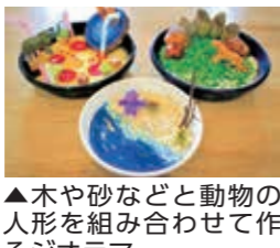
木や砂などと動物の人形を組み合わせて作るジオラマ