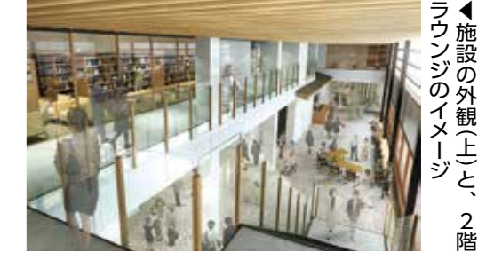
▲施設の外観(上)と、2階ラウンジのイメージ