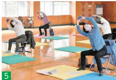
5 ▲寺泊コミュニティセンターで行った運動習慣セミナー。自宅でも簡単にできるストレッチなどで筋肉をほぐし、体を整えます