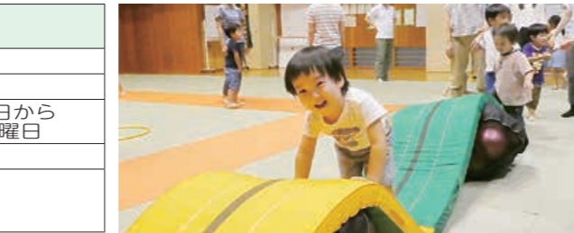
▲親子体操教室のマット遊び。親子や友だち同士で楽しくリズム感覚やバランス感覚を身につけます

回来年3月まで(1期4月～7月、2期9月～12月、3期来年1月～3月 ※一部、例外の教室あり。詳しい日程はお問い合わせください) ■対①めばえ…1歳6カ月～3歳児と保護者②ひよこ…3歳～6歳児と保護者③つばさ…小学1～3年生④つばさプラス…小学4～6年生⑤キッズラン…小学3～6年生 回4月5日(月)から