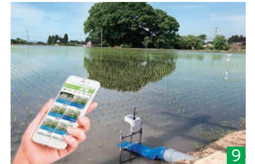
▲水田に設置したセンサーとスマートフォンの連携で作業効率を高める「長岡版スマートアグリ」の一例。水位の把握や自動での給水が可能になります