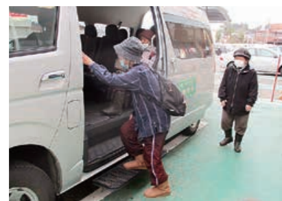
▲デマンドタクシー「景虎号」に乗り込む利用者

栃尾地域で、中心部と山間部を結ぶデマンドタクシーの本格運行を開始しました。買い物や通院での高齢者の交通手段を確保します。