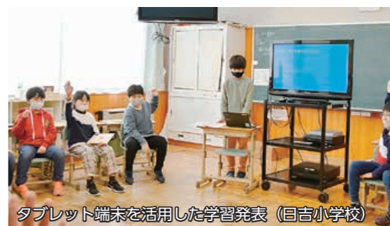
タブレット端末を活用した学習発表(目吉小学校)