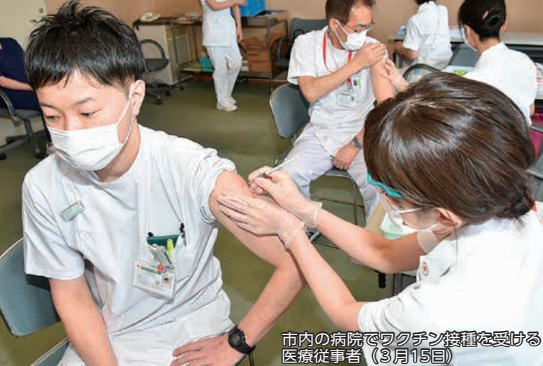
市内の病院でワクチン接種を受ける医療従事者(3月15日)