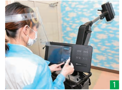
1 ▲市内の基幹病院が補助金を活用して導入した移動式のデジタルX線撮影装置。場所を問わず使用でき、柔軟な検査体制の確保につながります