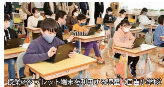
授業でタブレット端末を利用する児童(目吉小学校)

1 長岡市社会福祉協議会 ☎33・6000 2 長岡市パーソナル・サポート・センター ☎89・8263