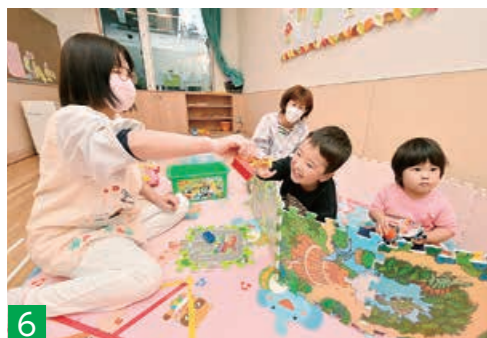
6 ▲平成30年4月に完成した東部川崎保育園に併設する病後児保育施設。現在市内7カ所の施設で、病気やその回復期の子どもを一時的に預かり、保護者をサポートしています