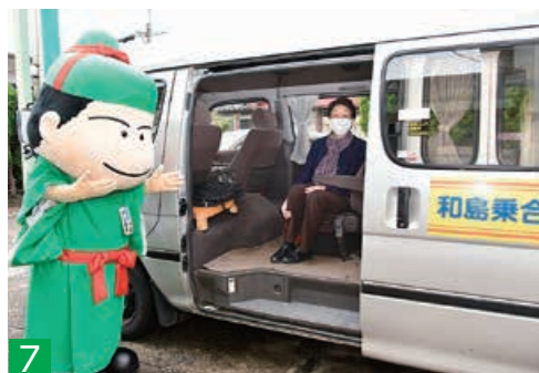
7 ▲和島地域で10月からの本格運行を目指し、実証実験を進めている予約制乗り合いタクシー