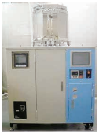
▶市内企業が補助金を活用して開発した、半導体部品に耐食性のある薄膜を均一に形成する装置

対付加価値の高い新製品・新技術の開発 補助額=対象経費の2分の1以内(事業者および学術機関などを中心とした3者以上で構成される連携体…上限300万円。製造業または情報サービス業…上限100万円)で、設立後10年以内、もしくは初めて公的資金を受け企業の開発の場合、対象経費の3分の2) 申5月31日(月)まで