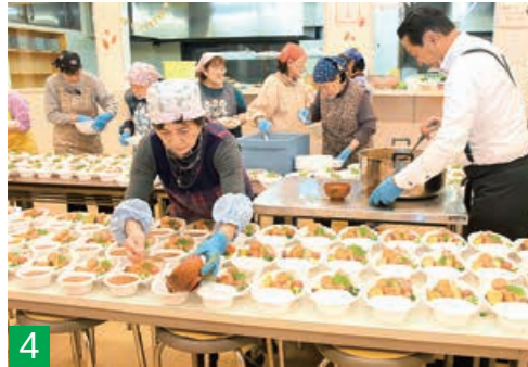
4 ▲越路地域の子ども食堂「塚山みんな食堂」で地域住民に配るため、300食以上の弁当を作る運営ボランティア