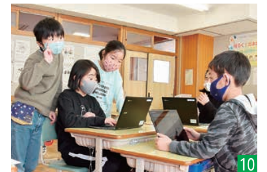
▲タブレット端末を活用し、掛け算の法則性などをグループで学習する日吉小学校3年生