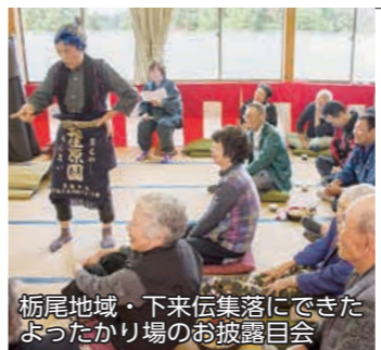
栃尾地域・下米伝集落にできたよったかり場のお披露目会

高齢者などが気軽に立ち寄り、お茶飲み話ができる交流の場「よったかり場」の立ち上げや運営を支援します。