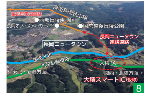
▲昨年10月に事業化が正式決定した大積スマートIC(仮称)。整備により、市内西部地区の企業活動の活性化や観光振興、防災力の向上などが期待されます