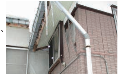
▲外壁の被害があった家屋。撮影の際は、転落などの事故に注意してください

罹災証明書の申請は? 被害状況を調査するため、発行まで1週間程度かかります。 ④被災家屋に住む人または所有者 ④本人確認書類、印鑑、被害状況が分かる写真 ④資産税課アオ ☎39・2213