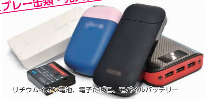
リチウムイオン電池、電子たばこ、モバイルバッテリー