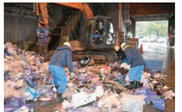
▲電池などを探し出す分別作業

リチウムイオン電池の発火によるごみ処理施設の火災が急増しています。令和2年度は、昨年12月末時点で95件と過去最多。施設の事故が続くと、ごみの収集に大きく影響します。正しい廃棄をお願いします。