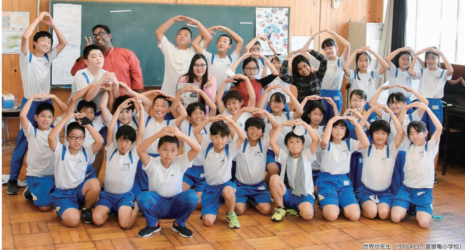
世界が先生（9月4日、富曾亀小学校）