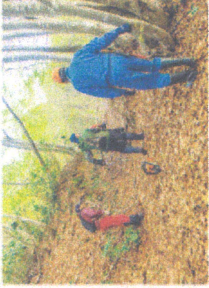
魚沼市歴史街道保存会の作業の様子。