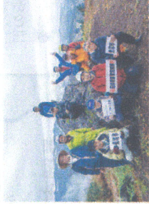
2023(令和5)年11月12日に「入東谷活性化プロジェクト」と「魚沼市歴史街道保存会」のそれぞれメンバーが参加して行われた「暫定接続式」の様子。