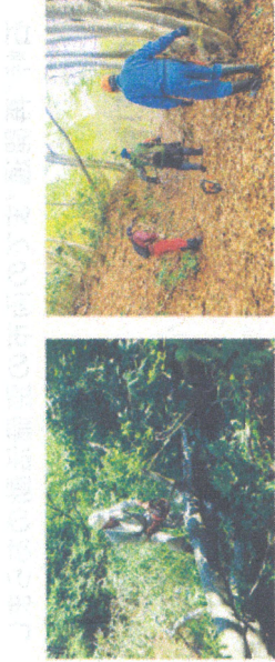
入東谷活性化プロジェクトの作業の様子。

2024(令和6)年の秋に大石の「石峠街道歴史資料館」(写真上)設置と魚沼市高倉地内の国道290号沿いの「旧石峠街道」案内看板(写真下)が改裝されました。