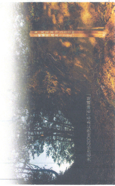
大石から300m左にある「石峠峠址」