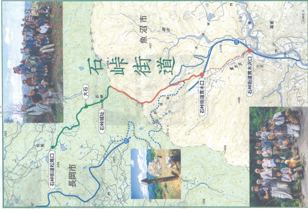
(.....部分は令和7年度中に完了予定)

約20年間石峠街道の整備が滞り、草や雑木が生え茂り、人が歩ける状態ではなくなっていました。数年前から地元の人一人がもくもくと整備を手掛けていました。長岡側の整備が進んでいくことから「長岡側のプロジェクト」との連携で石峠街道を全線再開通をさせよう」という話に賛同者が増え、令和5年度から「魚沼歴史街道保存会」を設立し、新潟県をはじめ魚沼市及び市教育委員会等の関係機関の指導と協力をいただきながら精力的な整備が進み、このほど長岡側と魚沼側の石峠街道が全線再開通するに至りました。今後も”歴史散策ツアー”のコースとして活用できるよう保存活動を継続することとしています。