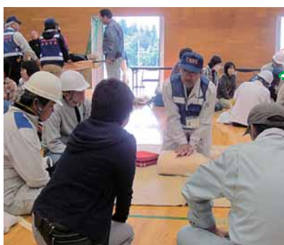
図 7月~11月の土曜日(計13回) 場 地元大学の教授をはじめとする全国の防災専門家、行政などの実務担

震災をきっかけに始まり、今年で9回目の同大学。これまでに386人が卒業し、自主防災会、町内会が主催する防災訓練などでAEDの取り扱い、心肺蘇生法を指導しています。