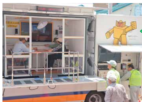
図 危機管理防災本部 アオ ☎39・2262

昨年度は約1200団体が利用。「防災意識が高まった」「改めて地震の怖さを感じた」などの声が寄せられています。