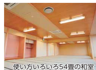
使い方いろいろ54畳の和室

教室の予約は電話または公共施設予約システムで受け付け中です。 ☎中央公民館 32・0437