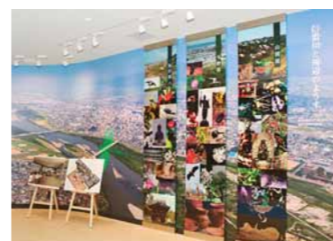
▲信濃川上空をトンボが舞う科学博物館の入り口