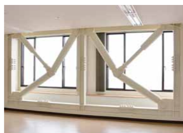
▲複数の「制振ダンパー付きプレス」でしっかり耐震補強

▼休日・夜間急患診療所は、シンプルな動線で結ばれる各診察室と広々として開放感のある待合室を整備