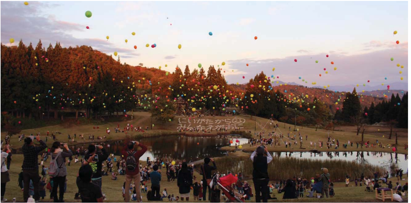
▲ソングオブジアース 2014 10.23 追悼式典 (川口運動公園)

復興 10 年の節目の年に、被災地復興の祈りを込め、各地域で様々な事業をフェニックスプロジェクトとして実施しました。フォーラムや講演会など通して経験と教訓を伝え、地域のお祭りなどの行事を通して元気に復興した姿を発信しました。