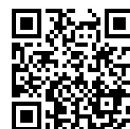
NST だいき にいがたチャンネル