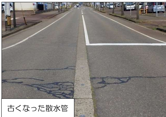
古くなった散水管