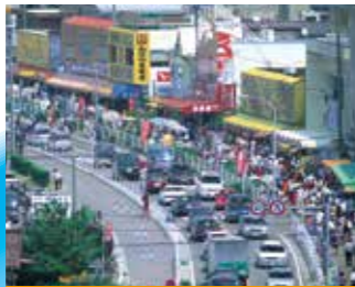
寺泊 魚の市場通り