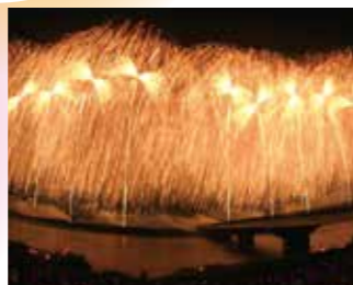
長岡まつり大花火大会