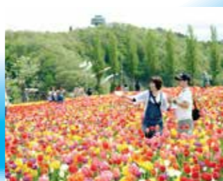
国営越後丘陵公園