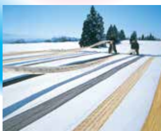
小千谷縮の雪さらし