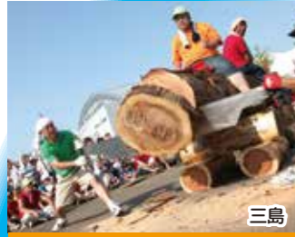
三島 全日本丸太早切選手権大会