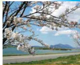
中之島 万本桜植樹帯