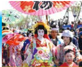
分水おいらん道中