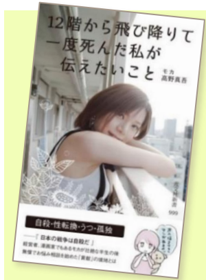
12階から飛び降りて一度死んだ私が伝えたいこと モカ(著) 高野真吾(著) 光文社新書