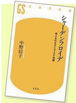
シャードンフロイデ 他人を引きずり下ろす快感 中野 信子 (著) 幻冬舎新書