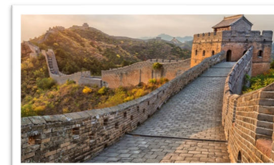
ばんりちょうじょう 万里長城