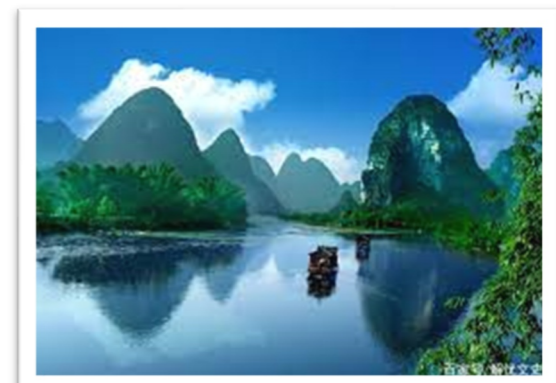
けいりんさんすい 桂林山水