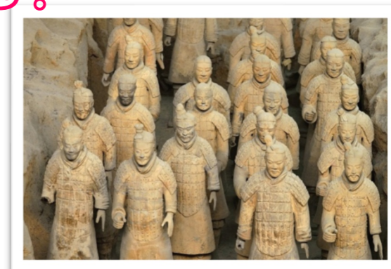
へいばよう 兵馬俑