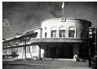
旧長岡赤十字病院