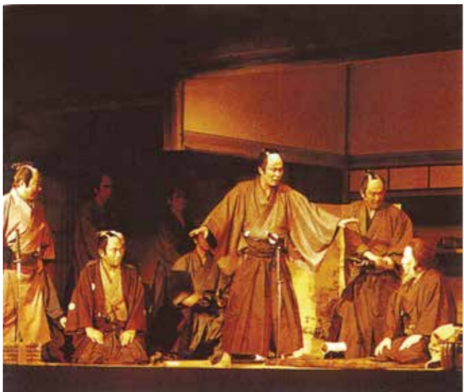
▲松竹大歌舞伎長岡特別公演「米百俵」 （昭和54年・長岡市立劇場）