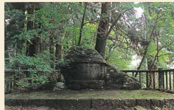
▲病翁碑(悠久山・蒼柴神社)