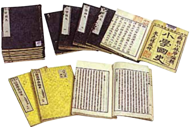
▲小林虎三郎の著書類 上：『小学国史』、下右：『興学私議』（『求志洞遺稿』）、 下左：『翻刊 德国学校論略』

まさに、山本有三が戯曲「米百俵」の中に記した「国がおこるのも、ほろびるのも、町が栄えるのも、衰えるのも、ことごとく人にある」という小林虎三郎の言葉に象徴