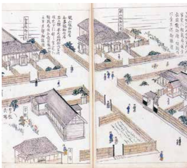
▲国漢学校之図（「長岡懐旧雑誌」下）

救援の米百俵が三根山藩から送られてきたのは、翌年五月頃でした。戯曲「米百俵」の一番の