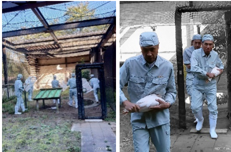
ケージ内に入って手際よく慎重に捕獲します

今年も秋の恒例行事、幼鳥を佐渡に送る日がやってきました。10月15日(火)に、今春生まれの4羽を移送しました。移送に先立ち、入念に身体計測や健康観察などを行います。