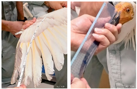
翼、嘴の長さを計測します

体重や体長、翼、嘴、脚の長さ、体温の計測、羽、口の中、顔や目など、体全体をくまなく観察します。鳥インフルエンザの抗原検査や性別を判定するための採血、足環を取り付けて写真撮影もを行います。検査は、トキにストレスをかけない様、抱き方にも配慮して進めます。最初にふ化のあった4月21日から約半年間、トキがケガや病気をしないよう見守り大切に育ててきました。健康状態万全で送り出せた