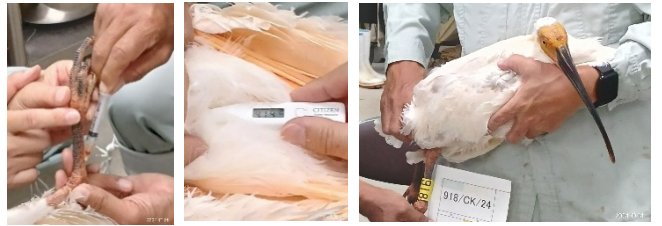
足の大きさ、体温の計測そして最後に全身の撮影をします