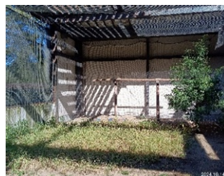
大掃除前のケージ。草が生えてます

トキの佐渡への移送の時期に合わせて恒例の大掃除と点検を行います。大掃除は数日かかりです。草取りを行い、トキが地面に着地する時の負担をやわらげるため、固くなった土を掘り起こし、新しい土を入れます。止まり木の点検をして、地面に金属片が落ちていないか、磁石を使って点検し、ケージに天敵が侵入しないよう防止用電気柵の点検も行いました。トキがいつでも安心して暮らせるように飼育員は見守り続けています。