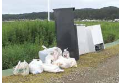
▲今年度発生した不法投棄の現場

不法投棄を発見したら、現場のごみをそのままにして、土地や施設の管理者に連絡してください。わからない場合は、環境業務課(0258-24-2837)か各支所市民生活課へ連絡してください。警察と連携して対応にあたります。