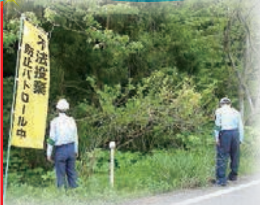
▲不法投棄防止パトロールの様子

ごみの不法投棄を発見したら、現場のごみはそのままにして、その土地・施設の所有者、または管理者へ連絡してください。わからない場合は、 環境業務課(☎0258-24-2837) または 各支所の市民生活課 へ連絡してください。管理者や警察と協力して対応にあたります。