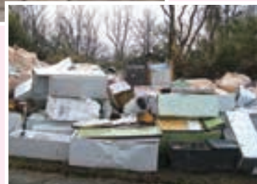
▲廃家電等の集積現場の例