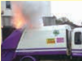
▲H27.10.27車両火災が発生しました

誤って「燃やさないごみ」で出すと、ごみ収集車の車両火災の原因になります。危険ですので中身を使い切り、必ず風通しの良い屋外でガスを抜き、「有害危険物」で出してください。屋内でガスは抜かないでください。