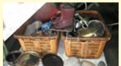
▲「びん・缶・ペットボトル」に混入した不適物

「なべ」や「フライパン」は、リサイクルの対象外ですので、「燃やさないごみ」に出してください。