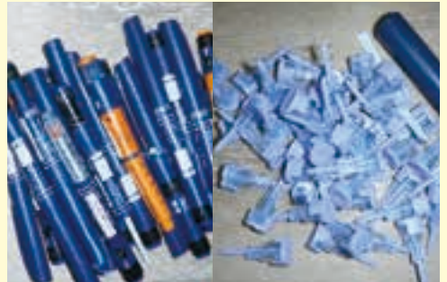
▲「プラスチック容器包装材」に混入したペン型自己注射器・注射針