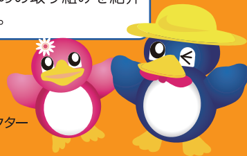
長岡の環境キャラクター ペギーちゃん

この情報誌では、長岡市のごみの現状や、ごみの減量とリサイクルを進めるための取り組みを紹介していきます。