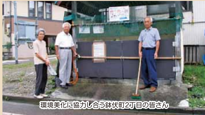
環境美化に協力し合う鉢伏町2丁目の皆さん

改善しないプラ容器の分別対策のため、袋に班と氏名を書いてもらうことを決定し、大きな反対もなく実施に至りました。