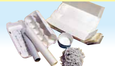
ミックスペーパー

耐水加工の飲料や食品容器、写真、シュレッダーくず等。透明な袋等に入れてください。