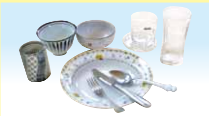
食器類 (瀬戸物・ガラス・金属)

壊れないよう紙等に包み、箱等に入れてください。(木・プラスチック製の食器、はしは不可)