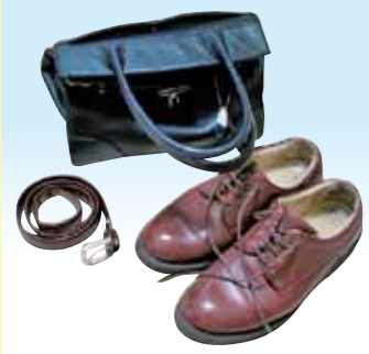
かばん・ベルト／靴

耐水加工の飲料や食品容器、写真、シュレッダーくず等。透明な袋等に入れてください。