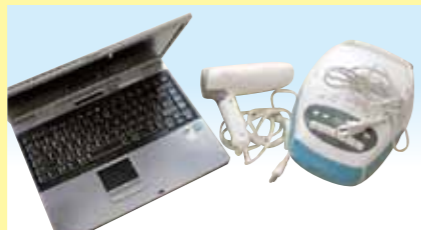
小型家電 (縦横約50cm以内)

壊れないよう紙等に包み、箱等に入れてください。(木・プラスチック製の食器、はしは不可)