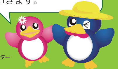
長岡の環境キャラクター ペギーちゃん

この情報誌は、長岡市のごみの現状や、ごみの減量とリサイクルを進めるための取り組みを紹介していきます。