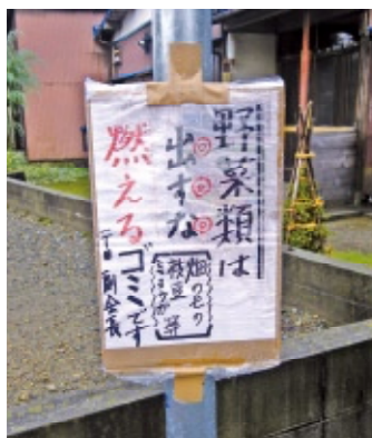
間違いの多い分別は、 手作り看板で呼びかけを。

ごみステーションに残される違反ごみは、どこの町内でも悩みの種。新保町内も同様で、「何とかしなければ」とのことから、みんなで少しずつ意識を持つことで改善してきました。