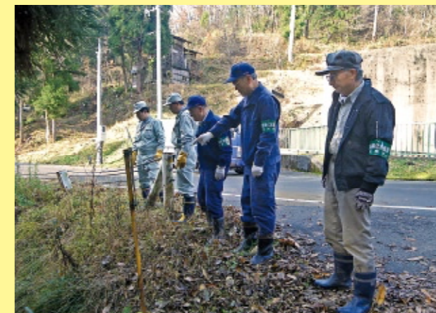
「環境美化重点地区」である成願寺地区でのパトロール

ごみの不法投棄を発見したら、現場のごみはそのままして、その土地・施設の所有者、または管理者へ連絡してください。わからない場合は環境業務課Tel24-2837(支所は市民生活課、栃尾支所は環境衛生課)へ連絡してください。管理者や警察と協力して対応にあたります。