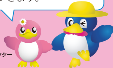
長岡の環境キャラクター ベギーちゃん

この情報誌は、長岡市のごみの現状や、ごみの減量とリサイクルを進めるための取り組みを紹介していきます。