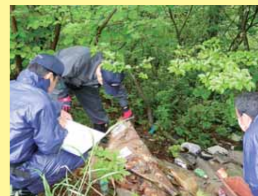
警察による不法投棄現場の検証