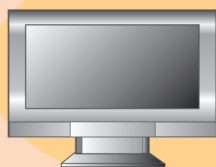
液晶式及びプラズマ式テレビ