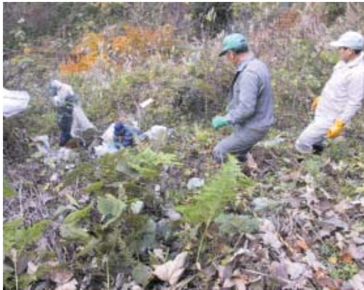
★環境美化推進員と協力して不法投棄物を回収