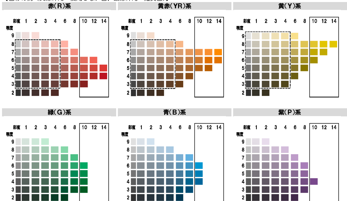
【色彩の例（実線枠内：使用しない色、破線枠内：推奨色）】