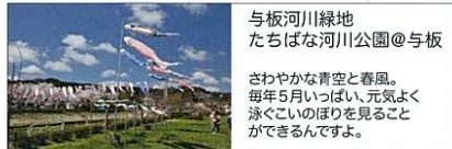
与板河川緑地 たちばな河川公園@与板 さわやかな青空と春風。 毎年5月いっぱい、元氣よく 泳ぐこいのぼりを見ること ができるんですよ。