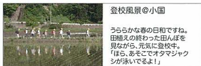
登校風景@小国 うららかな春の日和ですね。 田植えの終わった田んぼを 見ながら、元氣に登校中。 「ほら、あそでオタマジャク シが泳いでるよ!」