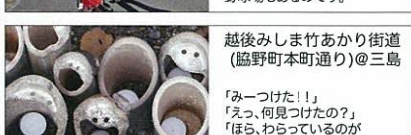
越後みしま竹あかり街道 (協野町本町通り)@三島 「みつけた!」 「えっ、何見つけたの?」 「ほら、わらっているのが あるでしょ。」