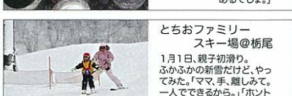
とちおファミリー スキー場@栃尾 1月1日、親子初滑り。 ふかふかの新雪だけど、やっ てみた。「ママ、手、離してみて。 一人できるから。」「ホント に大丈夫?」「へいきだよ」