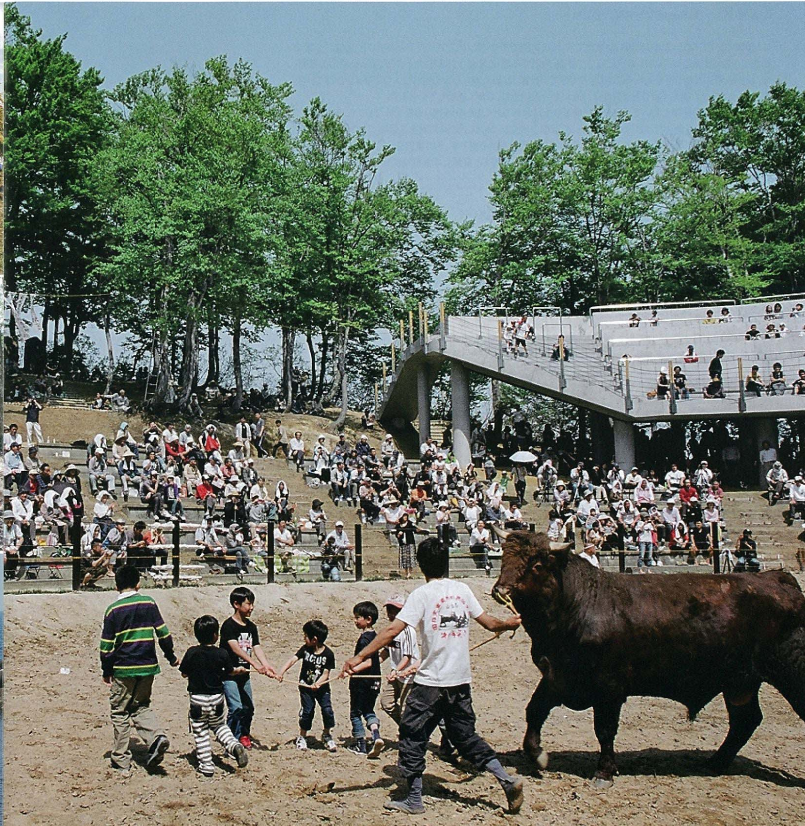
5月5日 こどもの日の山古志闘牛場 牛と子どもたちとブナ林