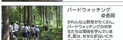
バードウォッチング @長岡 かれんな山野草がたくさん。 バードウォッチングの中学生 生たちは環境を学んでいます。 夏は、せせらぎ治いにホ タルがたくさん出ます。