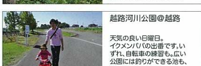
越路河川公園@越路 天気の良い日曜日。 イクメンの日の出番です。い ずれ、自転車の練習も。広い 公園には釣りができる池も、 野球場もあるんです。