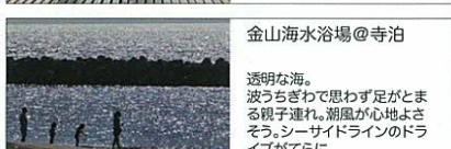
金山海水浴場@寺泊 透明な海。 波うちぎわで思わず足がとまる 親子連れ。潮風が心地よさ そう。シーサイドラインのドラ イフがてらに。