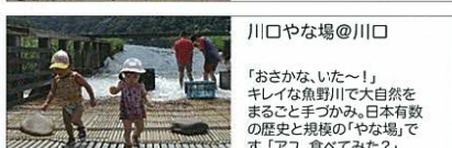
川口やな場@川口 「おさかな、いた〜!」 キレイな魚野川で大自然を まるごと手つかみ。日本有数の 歴史と規模の「やな場」で す。「アユ、食べてみた?」