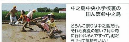
中之島中央小学校裏の 田んぼ@中之島 どろんこ祭りは中之島だけ。 それも真夏の暑い7月中旬 に行われるんですって。泥だ らけて気持ちいい!