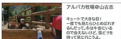
アルパカ牧場@山古志 キュートで大きな目! 一度でも見たらひとめぼれす るんだって。冬は牛舎にいら るので会えないけど、雪どけを 待つて見に行こうよ。