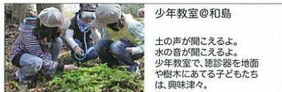
少年教室@和島 土の音が聞こえるよ。 水の音が聞こえるよ。 少年教室で、診察を地面 や樹木にあてる子どもたち は、興味津々。