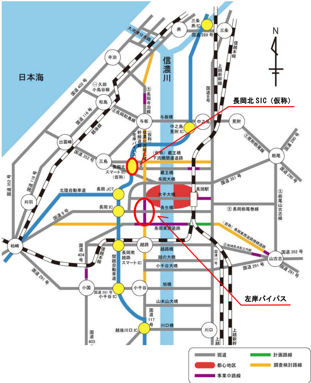
ラダー型広域幹線道路網