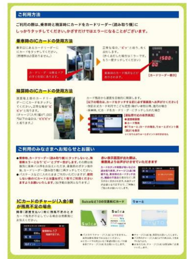
図 キャッシュレス決済開始の案内