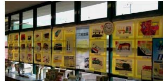
絵画展(商業施設にて開催)