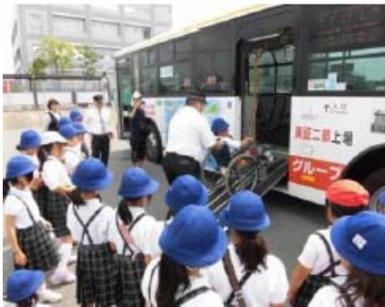
車イスでの乗車体験