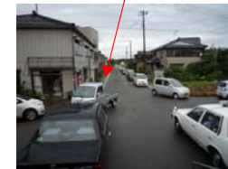
（朝：渋滞状況と逆走車両）