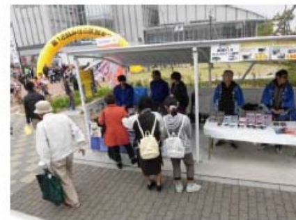
バス事業者とともに「みはら区民まつり」に参加