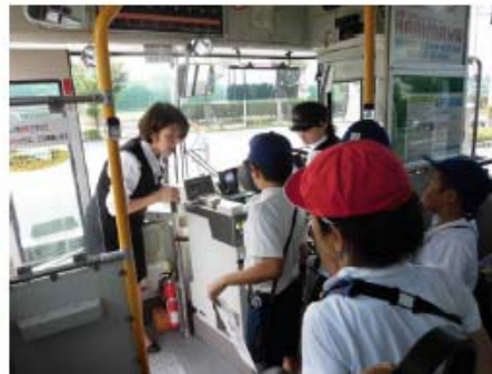
運賃の支払い体験