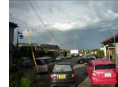
（夕：駅前を埋める送迎車両）