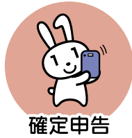
確定申告 (2024年度より)