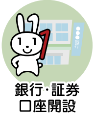
銀行・証券 口座開設