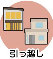
引っ越し (2023年7月頃より)