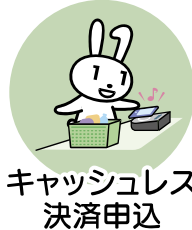
キャッシュレス 決済申込