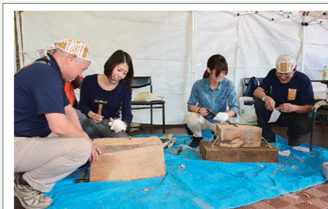
与板地域の伝統工芸品・打刃物の体験イベント