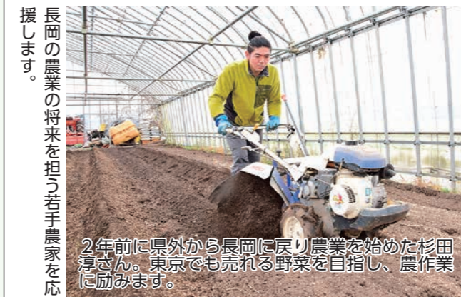
長岡の農業の将来を担う若手農家を応援します。