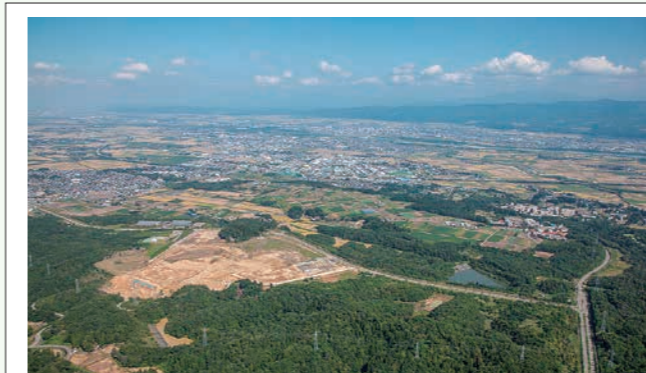
ヨネックス㈱が進出する西部丘陵東地区産業ゾーン（高頭町、深沢町）