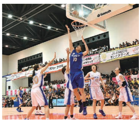
今年1月アオーレ長岡で、バスケットボールWリーグのオールスターゲームを開催。世界レベルのプレーで観客を魅了しました。

バスケットによるまちづくり 900万円 今秋開幕の男子プロバスケット「Bリーグ」に向け、まちなかのにぎわいを創出。リオデジャネイロ五輪の国際親善試合を誘致します。