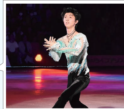
昨年7月の「フィギュアスケートアオー レ長岡」では、羽生結弦さんなどトップ スケーターが華麗な演技を披露しました。