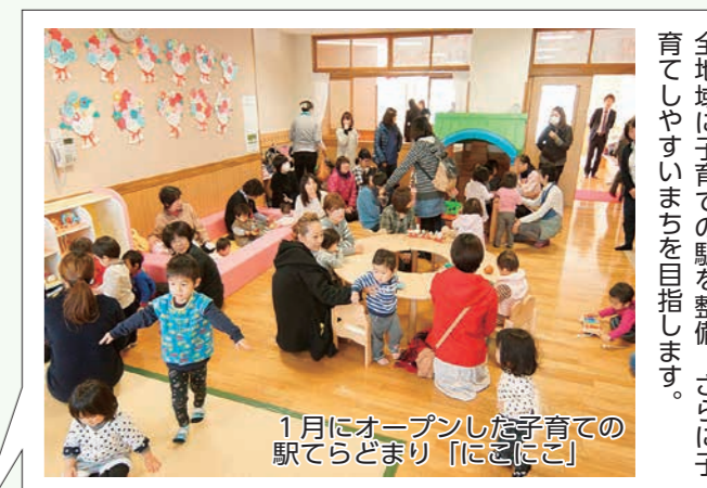
1月にオープンした子育ての駅でらどまり「にこにこ」