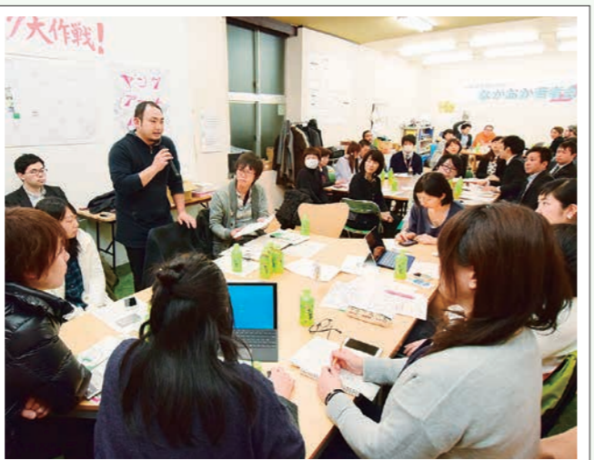
学生から30代が集まる若者会議。郷土愛や仕事づくりなどをテーマに、さまざまなプロジェクトを企画・試行します。