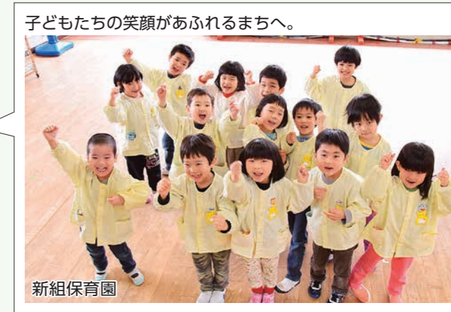
子どもたちの笑顔があふれるまちへ。