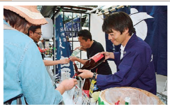
長岡の美酒を発信する越後長岡酒の陣