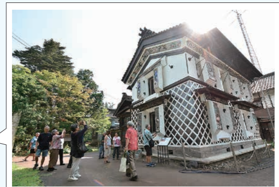
観光ツアーで摂田屋地区などを周 遊するホノルル市民

姉妹都市との日常交流に向けた 情報発信の支援 250万円 ラジオ番組で姉妹都市の情報を現地から伝えます。