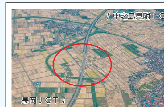
年度内の供用開始を目指し整 備を進めている長岡北スマ ートIC