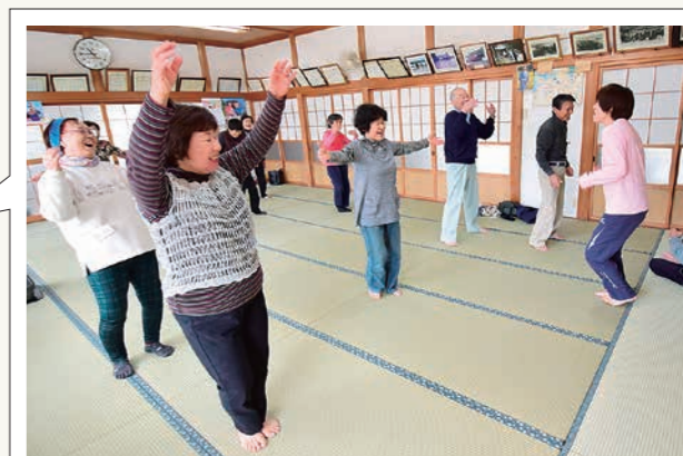
運動や介護予防講座を実施している中之島地域の「西野・西野新田じよんのび会」。「姿勢が良くなった」「片足立ちのまま靴下を履けるようになった」などの声が聞かれます。

地域インフラの整備（事業費総額） 238億6,862万円 道路や河川、学校、福祉施設、上下水道など、生活に密着した身近な公共事業を実施します。