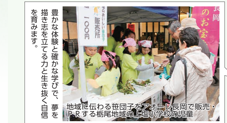
豊かな体験と確かな学びで、夢を描き志を立てる力と生き抜く自信を育みます。