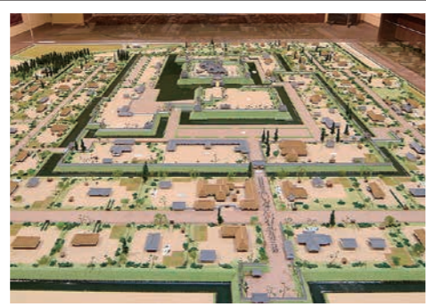
長岡藩主牧野家史料館の長岡城復元模型。同館では長岡藩の歴史や長岡の文化・精神を伝えています。

東京五輪・パラリンピックに向けた対応 2,651万円 五輪開催を機に火焰型土器を国内外へ発信。事前合宿の誘致や選手の育成強化、観光誘客を強化します。