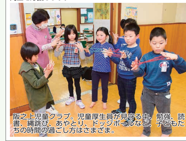
阪之上児童クラブ。児童厚生員が見守る中、勉強、読書、縄跳び、あやとり、ドッジボールなど、子どもたちの時間の過ごし方はさまざま。