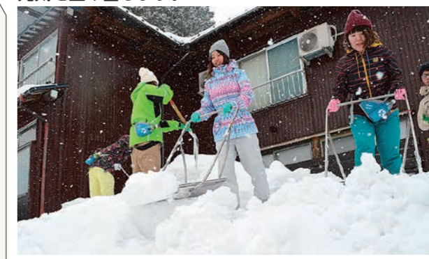
地域外との交流や住民の生活支援などを行い、地域の元気を生み出します。