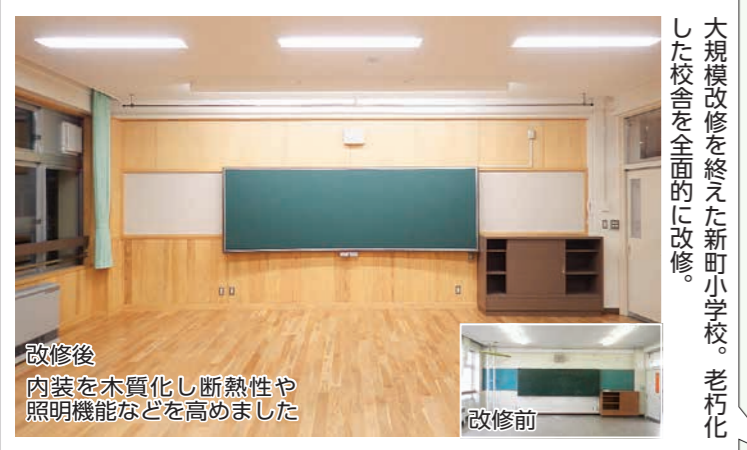
大規模改修を終えた新町小学校。老朽化した校舎を全面的に改修した。